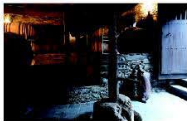
Antiguo lagar de vino

El valle donde se sitúan las vides del Bierzo posee una suave pendiente que nace en los bosques de pino de las montañas circundantes, protegiéndolo de las peores influencias del Atlántico. En la elaboración de vinos destacan como principales, entre las tintas, la Mencía y entre las blancas, Doña Blanca y Godello. La uva por excelencia es la Mencía productora de excelentes tintos, cultivándose en el 70% de la viña. Los tintos elaborados con uva mencía, destacan por su capacidad de envejecimiento. Los rosados, aromáticos, afrutados, vivos, ligeros y suaves. Los blancos, limpios y brillantes con tonalidades amarillas pajizas, tonos dulces y acidez viva.