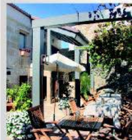
Calidad en producto, servicio y entorno

Las Rías Baixas son reconocidas por la excelente calidad de sus productos. Mariscos, pescados, carnes, quesos, hortalizas y frutas comparten mesa tanto en la cocina tradicional, como en los restaurantes más vanguardistas. Y es que la singular geografía de esta zona la convierte en un paraíso para los paladares más sibaritas. En nuestros restaurantes disfrutarás de la mejor gastronomía local merendada con un cuidado entorno, un esmerado servicio y, por supuesto, los mejores vinos.