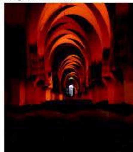
Bodega del Marco de Jerez

El Consejo Regulador de la Denominación Específica Brandy de Jerez es el encargado de salvaguardar la calidad del Brandy de Jerez. Este licor procedente de la destilación de vinos y envejecido en vasijas de roble americano previamente envinadas con Vino de Jerez, da lugar al Brandy de Jerez Solera, Brandy de Jerez Solera Reserva y Brandy de Jerez Solera Gran Reserva.