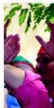
Taller de castellers

Enoturisme PENEDÈS ofrece al visitante distintas formas de descubrir esta tierra: en globo, en bicicleta, a caballo, a pie o mediante las rutas temáticas. Nada mejor que pasar unos días en los alojamientos del Penedès visitando bodegas y cavas, descubriendo, de la mano de sus restaurantes, la gastronomía de la zona. Así, es posible disfrutar de los talleres que se realizan alrededor de los viñedos y la vendimia, descubrir el paisaje mediante los