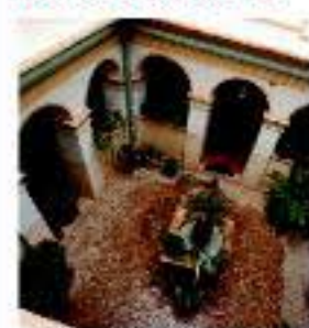
Patio Monasterio de Santa Ana

El municipio está surcado por alineaciones montañosas de enorme riqueza vegetal y paisajística, entre las que destaca la Sierra del Carche, declarada Parque Regional. En este paisaje se ha ideado la Ruta del Carche, que junto con las Rutas de las Sierras de