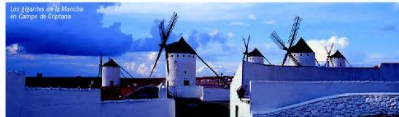
Los gigantes de la Mancha en Campo de Criptana

reconquista, gloria y leyenda y los literarios molinos. Junto a todo lo anterior, bodegas pioneras, tanto grandes como familiares, pero con gran tradición y dotadas con modernas infraestructuras. Y bodegas de nueva creación, pensadas para elaborar vinos de gran calidad al amparo de un marco arquitectónico destacable. O las bodegas ubicadas en parajes naturales de interés, presidiendo grandes extensiones de vid a lo largo de la llanura. Cada una de ellas están preparadas para recibir y acoger al visitante que ama y disfruta del vino.