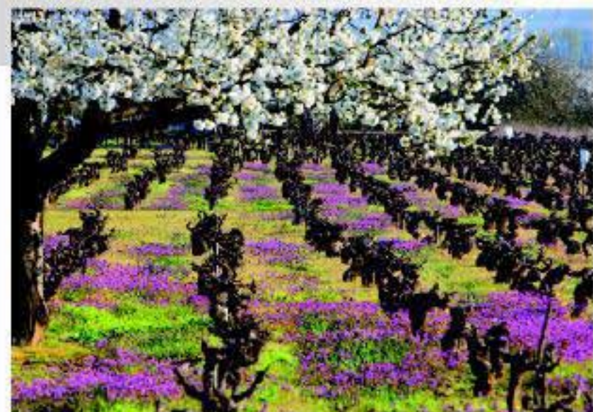
Viñedos de El Bierzo en primavera.

comarca. Jornadas Gastronómicas del Bierzo... además de todas las fiestas populares que se celebran en los municipios socios de la ruta del vino.