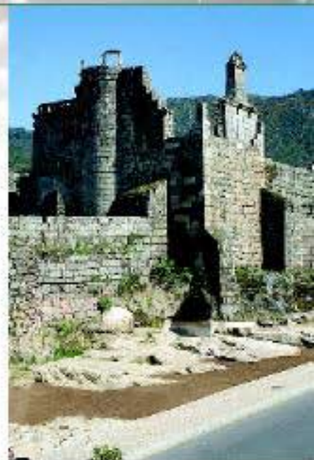
Castillo de los Sarmientos, Ribadavia

o simplemente dar un paseo por nuestras encantadoras tierras puede ser una opción para nuestros turistas. La Ruta do Viño do Ribeiro es una invitación para el viajero, libre de escoger entre las múltiples propuestas para disfrutar al máximo de su estancia en O Ribeiro.