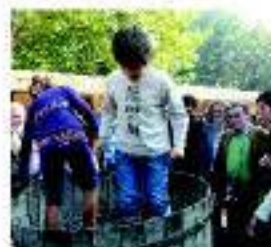
Fiesta del vino de Lleida

Además de las visitas guiadas por las distintas bodegas de la ruta, todas ellas con su propia historia, o cursos de cata de vino y aceite, destaca el variado patrimonio sus poblaciones, desde pequeños pueblos