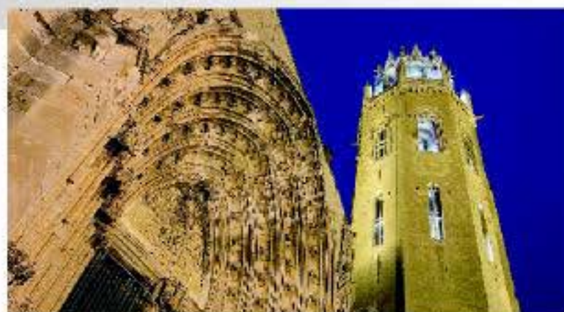
La Seu Vella de Lleida