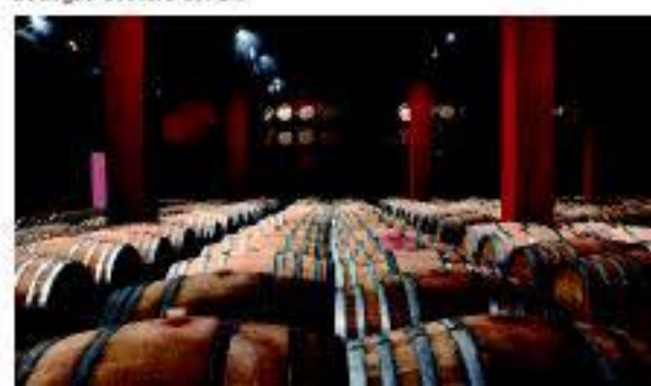
Bodegas Costers del Segre

Costers del Segre es una Denominación de Origen singular repartida en 7 diferentes subzonas, agrupa a la gran mayoría de las viñas de la provincia de Lleida, es pequeña al agrupar solo a 30 bodegas embotelladoras, y grande por su extensión, un territorio amplio y disperso que nos lleva de sur a norte, desde la última sierra del Montsant, con viñedos a 750 metros, hasta el Pirineo con viñas a más de 1.000, extendiéndose desde las sierras de Cervera hasta poniente de la provincia. Tierras calcáreas de llanos, cerros y montañas modeladas por un clima entre mediterráneo y continental, de amplios contrastes entre el día y la noche, con inviernos muy fríos y veranos calientes.