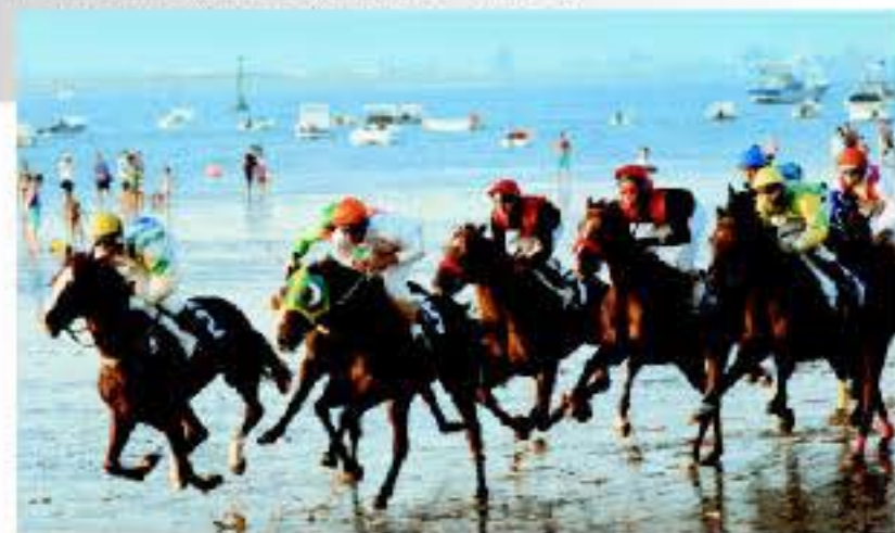
Carreras de Caballos de Sanlúcar de Barrameda

la Semana Santa y la Feria del Caballo de Jerez o las Carreras de Caballos en las playas de Sanlúcar de Barrameda. Pero el calendario festivo es más extenso y variado.