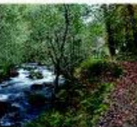
Una manera sossegada de conocer la comarca es recorrer sus rutas de senderismo.

Paseos en catamarán entre viñedos, degustaciones y catas en bodegas, la excelente gastronomía gallega, alojarse entre viñedos, aguas termales en balnearios, campos de golf, fiestas, actividades en el Club Náutico, rutas de senderismo, pasear en bicicleta entre los viñedos,