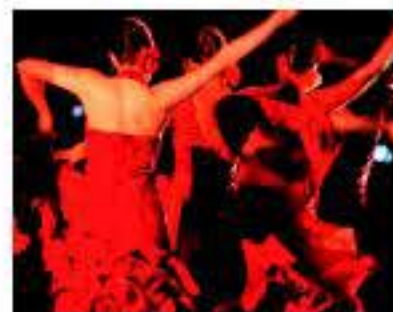
Flamenco en Jerez

La región por la que discurren las Rutas del Vino y Brandy del Marco de Jerez ofrece una diversidad que invita a adentrarse en sus manifestaciones culturales y en sus recursos naturales de una forma auténtica, disfrutando de cuanto ofrece el territorio. Rasgos singulares son una vasta cultura enológica a través de todos sus recursos y paisajes, su arquitectura, la hípica, los deportes náuticos, el golf, el arte flamenco y otras costumbres populares.