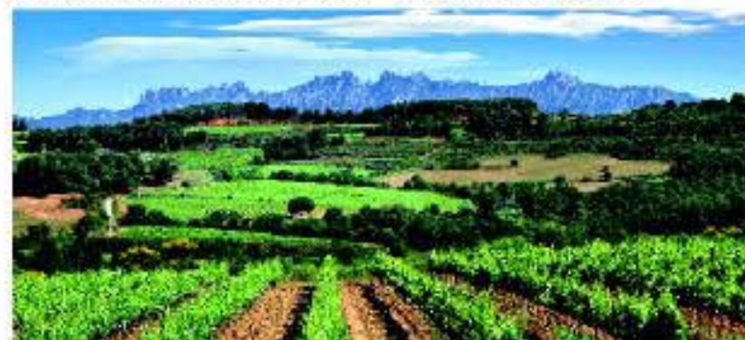
Paisaje del Penedès

María, ubicada en el centro histórico de Vilafranca del Penedès, junto con palacios y edificios de gran interés. El modernismo destaca en toda la región, pero sobre todo en Sant Sadurn d'Anoia, Vilafranca del Penedès y Gelida, con rutas guiadas por las tres localidades. Mediante VINSEUM, el Museo de las Culturas del Vino de Catalunya y el Centro de Interpretación del Cava, el visitante descubrirá toda la historia del vino y el cava.