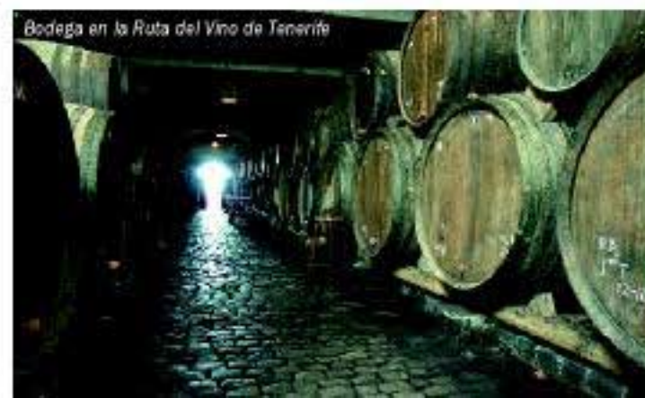
Bodega en la Ruta del Vino de Tenerife

Los vinos tintos constituyen su mayor producción. Las variedades locales más difundidas son la Listán Negro y la Negramoll, que dan vinos tintos que seducen al paladar por ser jóvenes y frescos, de aromas nuevos y afrutados que dejan un peso de boca amplio y suave, de gusto fragante, potente y de grandes resonancias. Los vinos blancos han ganado un sitio destacado en la buena mesa por su intenso aroma afrutado y un peso en boca vivo pero al mismo tiempo armonioso y equilibrado. Están elaborados principalmente a partir de las variedades Listán Blanco, Malvasía, Gual, Moscatel y Verdello. Sol, brisa y tierra volcánica junto al mar en un clima diverso, generoso y estable son los ingredientes naturales y únicos que conjugan la sorprendente personalidad de estos vinos.