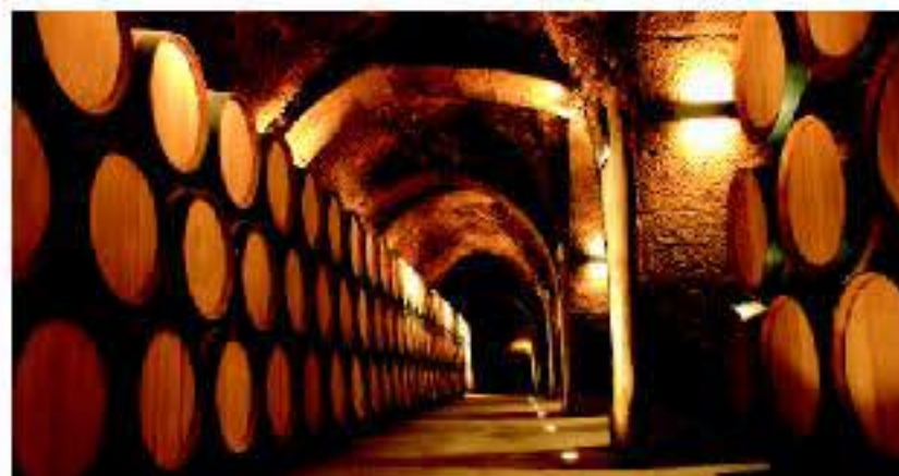
Bodegas Casa Primicia (Laguardia)

Elvillar, Labastida, Lanciego, Lapuebla de Labarca, Leza, Moreda de Álava, Navaridas, Oyón, Samaniego, Villabuena de Álava y Yécora, así como las cuatro Juntas Administrativas (Barriobusto, Labraza, Párganos y Salinillas de Buradón), constituyen un mosaico irresistible de recursos patrimoniales, cascos históricos, bodegas con personalidad, gentes afables y estampas paisajísticas que sitúan al viajero en una tierra que ha hecho del vino y de todo lo que le rodea su razón de ser.