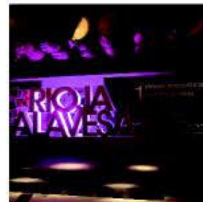
Eventos y reuniones entre viñedos

La Ruta del Vino de Rioja Alavesa dispone ya del Enobús, un original bus enoturístico que, por un precio muy asequible, permite conocer toda la comarca con un sistema de audioguías disponible en 4 idiomas. En Rioja Alavesa, además de vivir el vino a través de todos los sentidos, se puede disfrutar de un importante patrimonio cultural, natural, arqueológico y artístico íntimamente ligado a la cultura vitivinícola. Por ejemplo, destacan los cursos de cata, los recorridos por poblados de la edad de Bronce, las actividades de ocio en la naturaleza y los paseos entre villas amuralladas, viñedos y dólmeneos.