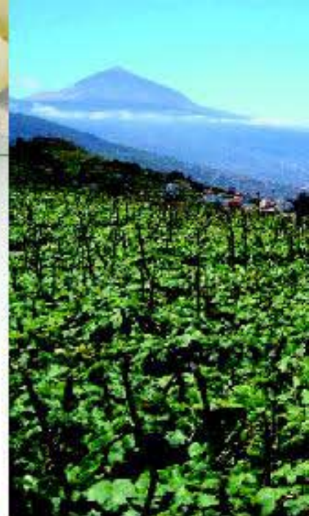
Ravelo viñas y Teide desde El Sauzal

tividades que se pueden realizar son la pesca acuática, la hípica, talleres gastronómicos o catas comentadas. Este proyecto pretende convertirse en una ruta a la carta, donde el visitante tenga la posibilidad de diseñar su visita de acuerdo con sus preferencias e intereses.