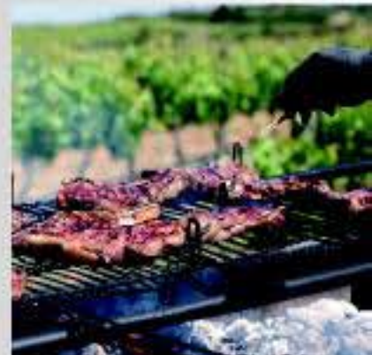
Parrillada entre viñedos

En la Ruta del Vino de Rioja Alavesa el visitante podrá encontrar restaurantes que unen en un mismo espacio los mejores vinos maridados con la afamada cocina de autor o la cocina vasca más tradicional, y podrá saborear así una gastronomía fiel a sus raíces bendecida por una despensa prodigiosa de legumbres, hortalizas y verduras, chacinas, carnes y dulces que ha legado al recetario popular algunos de sus mejores platos.