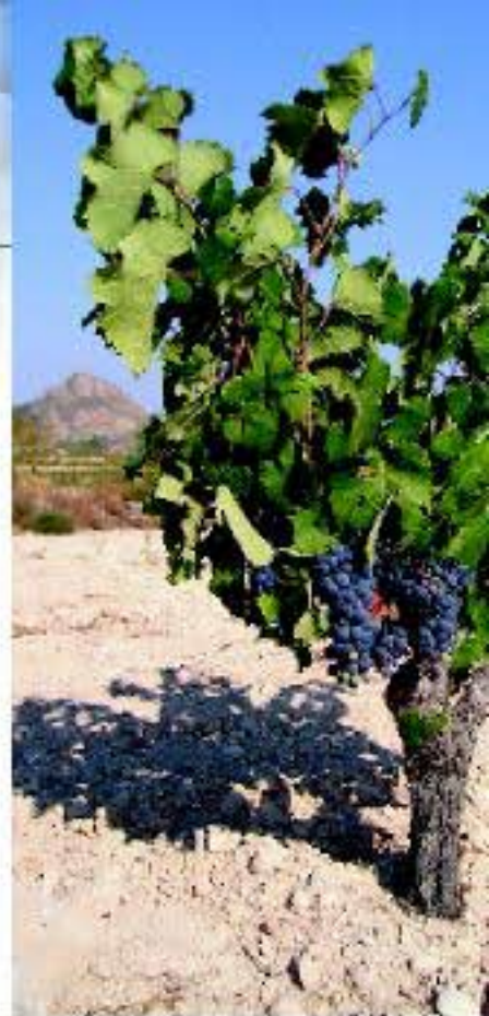
Viñedos en la tierra de Jumilla

Santa Ana, Sierra de la Pechera y Sierra de la Cirgá, conforman una variada oferta de paisaje y actividades, como el parapente, escalada, alta montaña, espeleología y el sendero de gran recorrido GR7, que proviene del norte de España y cruza todo el Levante.