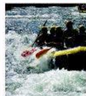
Descenso del río Cabriel

Perdersé en galerías subterráneas de época medievales, recorrer recintos amurallados y barrios mudéjares, participar en fiestas del vino y muestras de gastronomía local, hacer recorridos a caballo por sus bellos paisajes naturales, seguir