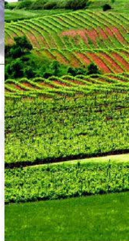
Viñedo de la Ruta del Vino de Navarra