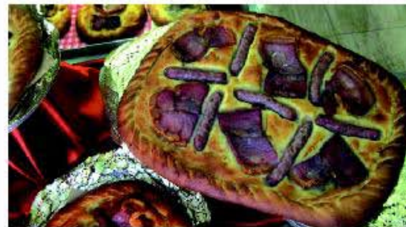
Platos típicos con embutidos protegidos

Además se podrá disfrutar de la naturaleza en su estado más puro en nuestros Parques Naturales Protegidos como son el Parque Natural de las Hoces del Cabriel y el Parque Geológico de Chera.