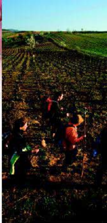
Camino de Santiago

Te proponemos un recorrido por las villas y pueblos de nuestra Ruta del Vino que acopian un extenso patrimonio cultural, natural, arqueológico y artístico. Todo ello tiene un denominador común, estar íntimamente ligado con los vinos de calidad, no lo dudes, no te dejará indiferente.