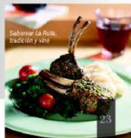
Saborear La Ruta, tradición y vino

La Ruta de la Garnacha sabe a tradición y a vino, a Tempranillo, Cabernet, Merlot, Syrah y por supuesto, Garnacha. Con ella se elaboran caldos afrutados, equilibrados y que acompañan perfectamente al ternasco, a pimientos y espárragos de las riberas del Canal de Lodosa, a un asado de cabrito moncaíno, a un plato de migas con chorizo y uvas, al pan recién horneado rociado con aceite de empeltre y arbequina o untado con caviar de oliva de la sierra del Moncayo o al queso de oveja de Bureta con miel de Fuendejalón.