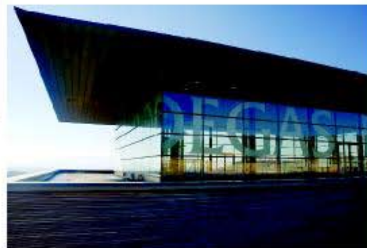
Bodegas Baigorri (Samaniego)

Rioja Alavesa cuenta con 13.500 hectáreas de viñedos. La cosecha media anual se aproxima a los 40 millones de litros de vino. Sus vinos, elaborados dentro del marco de control del Consejo Regulador de la D.O. Calificada Rioja, gozan de un merecido prestigio. La calidad de sus caldos se debe, en gran medida, al suelo arcillo-calcareo, al clima y a la ubicación de los viñedos, tras la Sierra de Cantabria, así como al cuidado de sus gentes en conjugar el legado histórico de elaboración y las nuevas tecnologías. La mayor parte del vino que se produce se elabora a partir de la variedad Tempranillo. El extraordinario vino tinto de Rioja Alavesa tiene un color brillante, un fino aroma, un sabor afrutado y un paladar agradable.