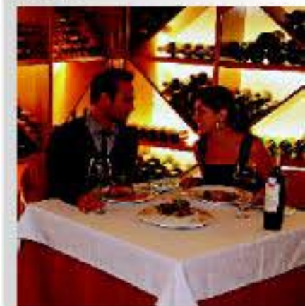
Degustar la rica gastronomía de la zona y regarlo con el vino de la D.O. Utiel Requena es un placer al alcance del visitante.

La comarca cuenta con una rica y variada gastronomía, resaltando nuestro bien gastronómico más preciado, el embutido, que engloba una gran variedad de productos como la longaniza, la morcilla, el chorizo, la guñía, etc. Entre los platos típicos destacan el ajamiero, el arroz a la cazuela o con bajocas, las patatas en caldo, y otros cocinados con carnes de caza como los gazpachos y el morteruelo; sin olvidar postres como los burruecos o el alajú.