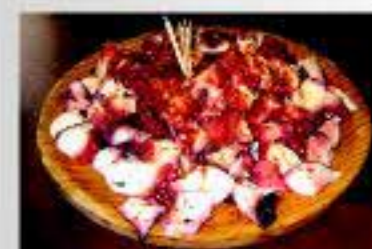
El pulpo "a feira" no puede faltar en cualquier reunión, romana o feira (fiesta) que se precie.

El visitante podrá encontrar restaurantes donde degustar platos típicos de la cocina gallega, regados siempre con los mejores vinos del Ribeiro. Los productos utilizados se caracterizan por su excelente calidad, marcada por el territorio (tierra y agua) en la que se producen. No es posible visitar la Ruta sin probar alguno de los platos estrella de nuestro territorio: el pulpo, las anguilas o los pimientos, siempre acompañados de nuestros vinos de la D.O. del Ribeiro.