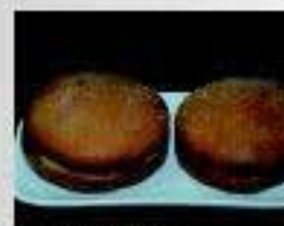
Tomijas de Bullas

La gastronomía típica de Bullas responde a las propias características geográficas, climáticas y culturales de la zona. Existe una gran variedad de platos tradicionales, entre los que destacan el ajo-harina, el empedrao (arroz con alubias, pimientos y bacalao), el arroz con conejo, las migas y las patatas en llenda. Entre los aperitivos y ensaladas se puede señalar el rin ran, los minchirones y la pipirana, y entre los postres, las tomijas de Bullas, únicas en su género.