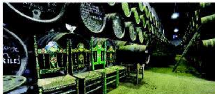
Lagar en la Ruta del Vino Montilla Moriles

algunos centros de la Red Vinarea. Que mejor manera de conocer nuestra ruta que a través de una cata dirigida, un paseo por la vinya, una visita a nuestros museos, lagares y bodegas, un buen desayuno molinero y otros muchos servicios y actividades.