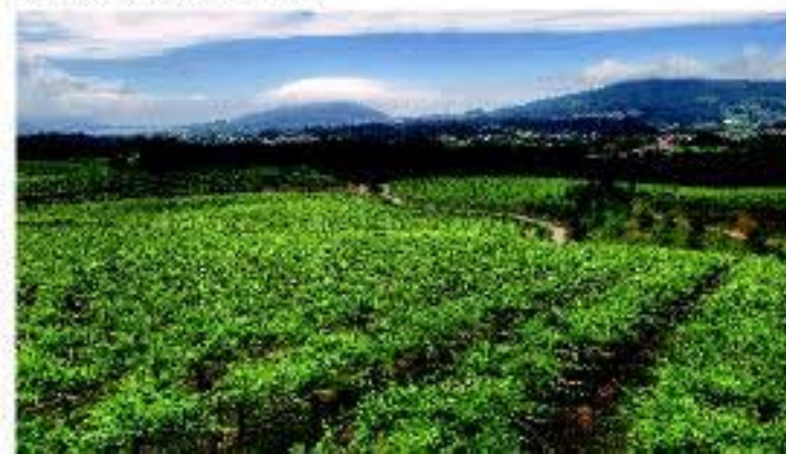
Paisaje de viñedos emparrados con el océano Atlántico al fondo

La Denominación de Origen Rías Baixas ha sabido conjugar lo mejor de la tradición con las más innovadoras técnicas vitivinícolas, consiguiendo unos vinos de excelente calidad y acusada personalidad, que los hace únicos en el panorama internacional. El respeto y cariño a la tradición ancestral tiene su reflejo, no sólo en la elaboración de vinos exclusivamente a partir de las variedades de uva autóctonas, con el Albariño como especial protagonista, sino también en su peculiar paisaje de viñedos. En concreto en el dominio del singular cultivo en emparrado, en la reducida dimensión de los terrenos y en el mantenimiento de la vendimia manual, donde cada viticultor pone especial atención en el cuidado y selección de la uva.