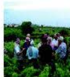
Actividades en viñedo en la Ruta del Vino de Tenerife

Este territorio rico en paisaje y clima ofrece una variada gama de actividades. Dentro de esta oferta de ocio y tiempo libre, el visitante puede disfrutar de un rico baño en una de sus playas de arena negra, o adentrarse y recorrer senderos a través de sus singulares bosques. Otras ac-