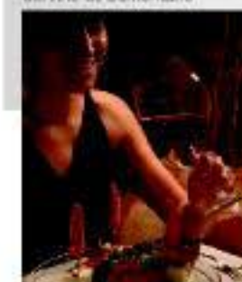
Restaurante de la Ruta del Vino de Somontano

En Somontano se puede saborear los placeres de la buena vida y disfrutar de las exquisitas propuestas gastronómicas de sus restaurantes y bares de vinos y tapas. Cocina tradicional y casera o vanguardista y de autor. Siempre con la base de una distinguida materia prima procedente de la reconocida huerta del Vero o de los productos artesanos de la zona, como quesos, aceites, embutidos o dulces típicos. Es la mejor oportunidad para descubrir el perfecto maridaje de sus vinos en el territorio que les ve nacer.