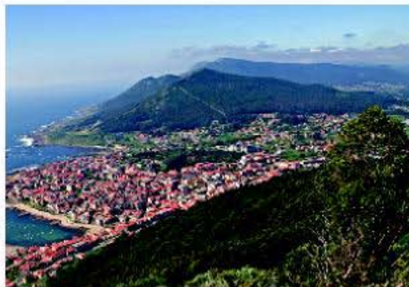
Rías Baixas. Un entorno privilegiado para todo tipo de actividades

ta, jugar al golf, practicar vela y otros deportes náuticos, pescar, ir en kayak... O si lo que buscas es relajarte puedes probar algunos de nuestros spas, pasear por maravillosos jardines o disfrutar de los vinos Rías Baixas en un marco incomparable.