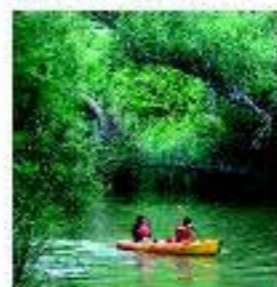
Piragüismo en el Duero

La Ruta del Vino Ribera del Duero permite a los viajeros disfrutar de unos paisajes donde flora y fauna siguen siendo protagonistas. Uno de esos lugares es, por ejemplo, el Parque Natural de las Hoces del Río Riaza. Ya en pleno río Duero, buena parte de sus orillas se encuentran acondicionadas con senderos que pueden