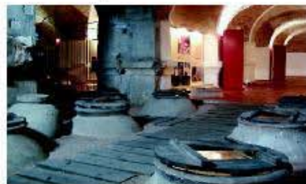
Museo del Vino de Bullas

Bullas es tradicionalmente una zona de producción de vinos tintos, lo que no impide que también se elaboren varios blancos y rosados de primer orden. Si una variedad de uva se halla indisolublemente unida a las tierras de Bullas, ésa es la Monastrell, típica del área Mediterránea, que representa la inconfundible identidad del antiguo Reino de Murcia y es la variedad autóctona de la Denominación de Origen. De aspecto compacto, grano pequeño y con un color azul-violetáceo muy intenso, proporciona una fuerte personalidad a los vinos de Bullas, no solo por su color, aroma y sabor, sino también por la abundancia en ella de componentes químicos que le otorgan propiedades beneficiosas para la salud.