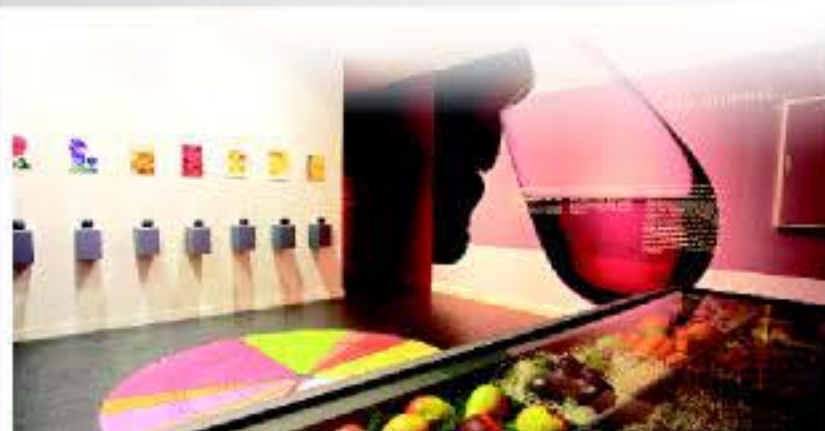
Museo del Vino

como el pesado de los niños en Albata, las Subidas del Mayo y las romerías muy presentes en casi todos los municipios, etc. La Semana Santa es otro de los momentos esperados, destacando la de Borja considerada como Fiesta de Interés Turístico Regional.