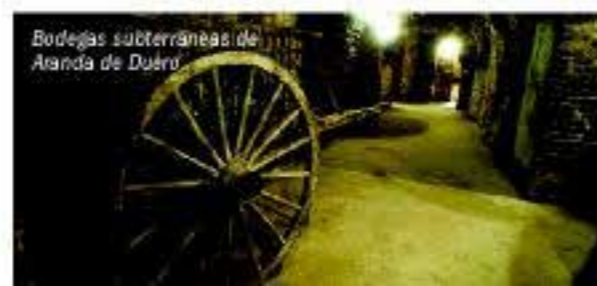
Bodegas subterráneas de Aranda de Duero

Nuestros vinos contienen la esencia de su tierra y de su gente, pues de esas condiciones climatológicas y del trabajo de sus viticultores y bodegueros depende la calidad de los vinos de la Ribera del Duero. Vinos rosados, tintos jóvenes y jóvenes robles, crianzas, reservas y grandes reservas, distintas modalidades en botella, pero con un denominador común: la uva Tempranillo. Un fruto autóctono, propio de la Ribera del Duero, y que aporta el color, el aroma y el cuerpo para que nuestros vinos sean especiales. Junto a la Tempranillo, el Consejo Regulador permite otras variedades: tintas como Cabernet-Sauvignon, Merlot, Malbec y Garnacha Tinta o la única blanca autorizada, la Albillo. Son seis variedades de uva para un sabor único e inconfundible, que marca la calidad en cada botella.