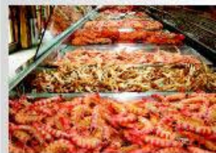
Cocedero de marisco en el Puerto de Santa María

El paso de culturas por el Marco de Jerez y los inmejorables productos frescos de la región, entre los que destacamos los pescados y mariscos de la Bahía y los universales vinos, brandies y vinagres de Jerez, dan lugar a una sorprendente y variada gastronomía. Una cocina que está presente en magníficos restaurantes, tabernas marineras, tabancos, bares de tapas, ventas y mostos en viñas que ofrecen un ambiente acogedor y una amplia oferta de platos tradicionales y tapas típicas.