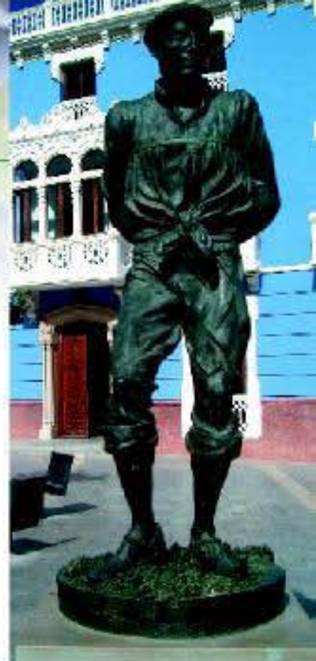
Monumento al Viticultor y Casa de la Cultura

se celebra el primer domingo de cada mes en pleno casco antiguo de Bullas, e incluye en cada edición demostraciones artesanales de diferentes productos. El mes de octubre está dedicado al vino.