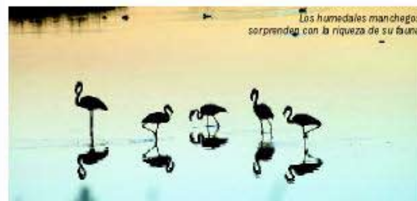
Los humedales manchegos sorprenden con la riqueza de su fauna

la Ruta de Don Quijote. Por estas mismas tierras discurrieron las aventuras del ingenioso hidalgo ideado por Cervantes. Sin duda, hay que conocer estas tierras de caballeros y viticultores, de bullicio y sosiego. "En un lugar de la Mancha...", así comienza la aventura.