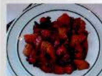
Gastronomía típica de la Ruta del Vino

El visitante tiene la posibilidad de degustar un sinfín de platos ricos, variados y típicos del lugar o bien deleitarse con una novedosa cocina creativa en auge. Son platos típicos y recomendados la vieja con papas arrugadas, el pulpo con pimienta verde, las lapas asadas o la morena frita, vinculados todos ellos al mar. Hay que destacar también los típicos asaderos o restaurantes de carne a la brasa, donde se pueden encontrar platos tan tradicionales como el escaldón, el puchero, la ropa vieja, chorizos, chistorras y chuletas, sin que falten productos tan arraigados como el gofio o la cebolla de Guayonje.