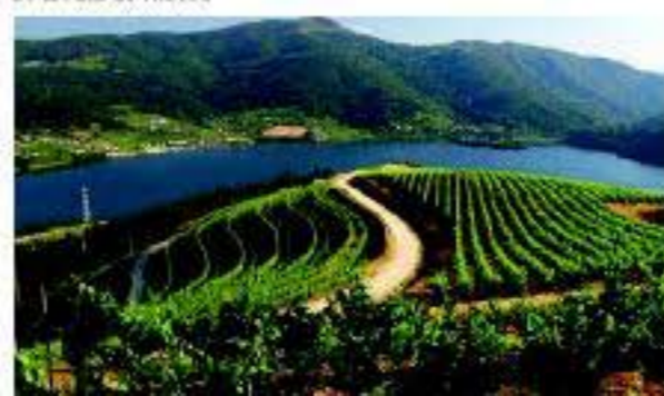
Panorámica de uno de los valles de la ruta do Ribeiro

El vino tostado es un vino dulce, elaborado con el mosto de las mejores uvas convenientemente pasificadas. Su producción es laboriosa y compleja, una auténtica joya de la enología de características únicas.