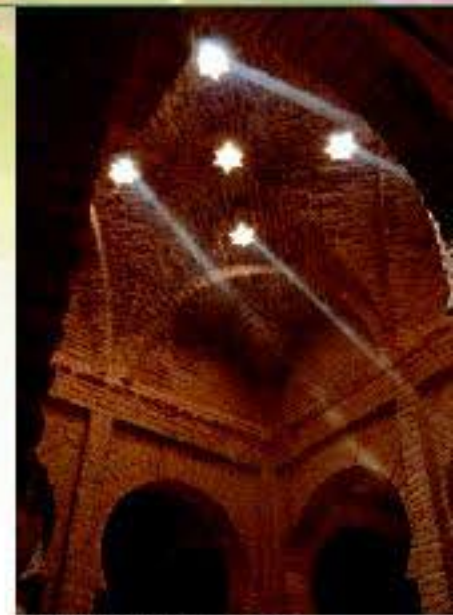
Baños Árabes del Alcázar de Jerez

como fortalezas árabes, castillos medievales, catedrales e iglesias de estilo gótico, mudéjar, renacentista y barroco, las grandiosas casas-palacios que nos hablan de la imperiosa época del mercado de ultramar, de la conquista de América y del esplendor del Vino de Jerez, alcanzado en el siglo XVIII y que dio origen a muchas de estas edificaciones y a las famosas bodegas del Marco de Jerez. Otras edificaciones a destacar son los toros, las plazas de toros, además de innumerables atractivos culturales, deportivos y de ocio.