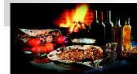
Productos típicos de la gastronomía jumillana

La gastronomía jumillana está influenciada por la cocina mediterránea y la manchega debido a su situación geográfica y su climatología, siendo sus platos sabrosos y variados. Son conocidos los gazpachos jumillanos, el arroz y conejo, el relleno o pelotas, el cabrito frito con ajos, queso de cabra frito con tomate, el trigoentero, las empanadas de patata, la gachamiga y el motinguero. En cuanto a dulces típicos hay que paladear los seculillos, las pirusas, las critóbalas y los rollos de vino y de amor que necesariamente acompañan a un dulce Monastrell.