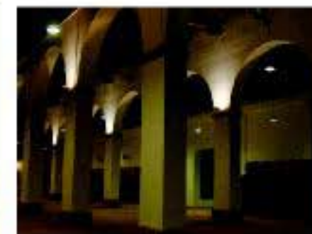
Nave de crianza de la Bodega Vinícola del Condado en Bollullos par del Condado.

En la D.O. Condado de Huelva se elaboran, por una parte, los vinos generosos andaluces, criados con el tradicional sistema de criaderas y soleras, bien mediante crianza biológica, como los Condado Pálido, vinos finos criados bajo velo de flor con una graduación alcohólica de 15° a 17°, o mediante crianza oxidativa, como los Condado Viejo, vinos dulzores con una graduación alcohólica de 15° a 22°. Dentro de este apartado de vinos generosos, se elaboran también los denominados Condado de Licor, que puede ser secos y abocados y que se comercializan como Vinos Dulces, Pale Dry, Medium, Cream, Pale Cream y Vinos de Naranja. Por otra parte, el Condado de Huelva sigue produciendo vinos blancos de elaboración tradicional, como son los Condado Blanco, los Condado Tradicional y Condado Joven. Este último es el buque insignia de esta D.O. y a la elaboración del mismo se dedica la mayor parte de la uva recolectada en sus tierras.