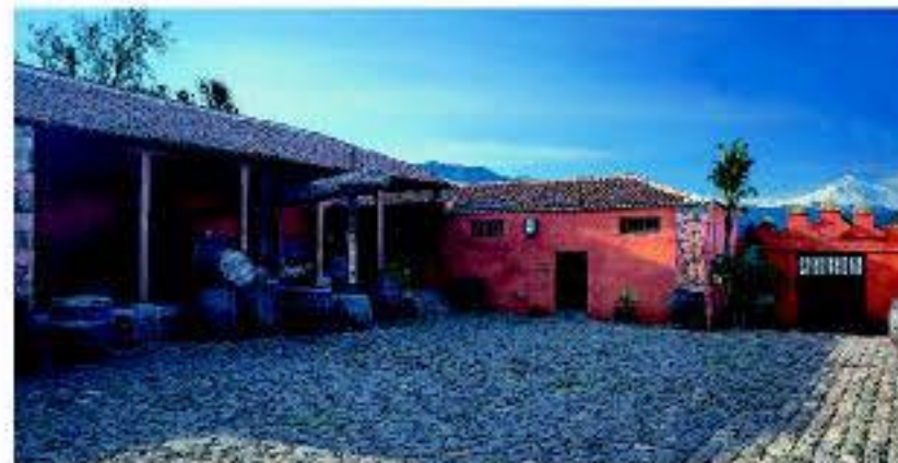
Casa del Vino La Baranda

Laguna, declarada Ciudad Patrimonio de la Humanidad por la UNESCO, con un sinfín de ermitas, iglesias, parroquias y antiguas casas o haciendas rescatadas y utilizadas como centros culturales o de visitantes. También importantes son los paisajes naturales protegidos, como el de Las Lagunetas, la Reserva Natural Especial de las Palomas y la Costa de Acentejo. Existe un gran número de senderos habilitados y muchas zonas recreativas preparadas para el ocio y disfrute durante cualquier época del año.