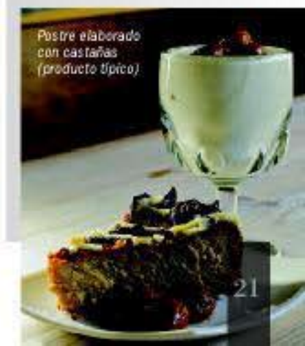
Pastre elaborado con castañas (producto típico)

En el Bierzo se dan ricos y variados productos gastronómicos que ofrecen un amplio abanico de posibilidades. El más famoso de sus productos es el Botillo, un embutido único de sabor inconfundible. De la tierra nacen productos como la manzana reineta, la pera conferencia, el pimiento del Bierzo, y la castaña, cada uno de ellos con su Consejo Regulador Denominación de Origen, junto con el del vino.