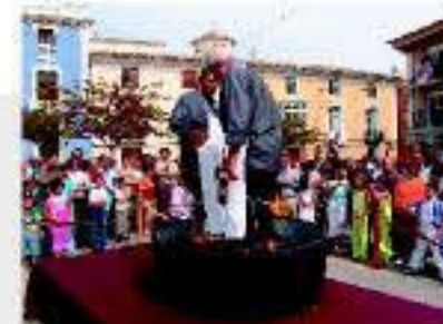
Pedra de la Uva

de los antiguos jaraicos y la bodega propiamente dicha, en la que destacan las bóvedas de crudería perfectamente conservadas. El centro histórico de Bullas alberga diversos puntos de interés, como la Plaza de España, donde se sitúan la iglesia parroquial de Ntra. Sra. del Rosario (siglos XVIII-XX), la Casa de la Cultura y el Monumento al Viticultor. La Plaza Vieja y sus alrededores se caracterizan por sus coloristas fachadas y aún albergan restos de la antigua fortaleza medieval de Bullas. Otros lugares a reseñar son la Bodega de la Balsa (antiguo lugar rehabilitado), la Torre del Reloj o la Casa-Museo Don Pepe Marsilia, que recrea los modos de vida en la localidad a finales del siglo XIX. Entre los parajes naturales se puede destacar el emblemático Salto del Usero, en el curso alto del río Mula, el monte Castellar o las extensiones de viñedos del Valle del Acoriche o la Venta del Pino.