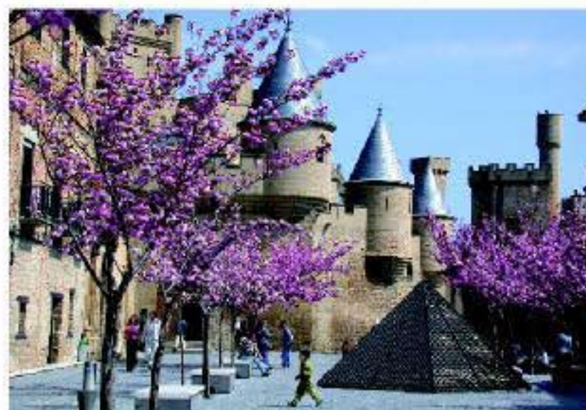
Palacio Real de Olite

única por su planta octogonal. Su historia encierra misteriosos enigmas relacionados con los templarios. Pasear por esta tierra afortunada permite conocer importantes hitos patrimoniales, como el Palacio Real de Olite, el Cerco de Artozona, la Iglesia Fortaleza de Ujué, el Hórreo de Iracheta, el Monasterio Cisterciense de la Oliva, la Ermita Románica del Santo Cristo de Catalain, el desierto estepario de las Bardenas Reales de Navarra o el Puente Románico de Puente la Reina-Gares.