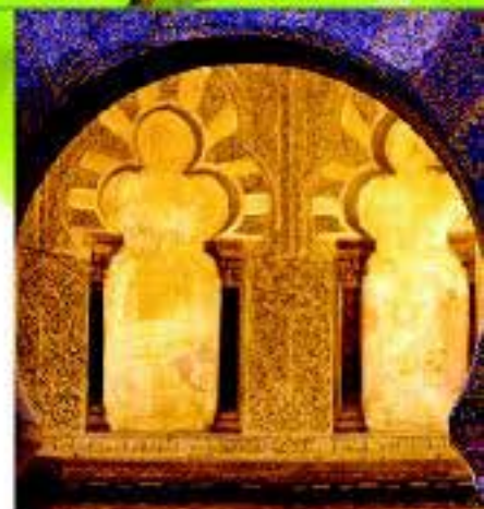
Mezquita - Catedral de Córdoba