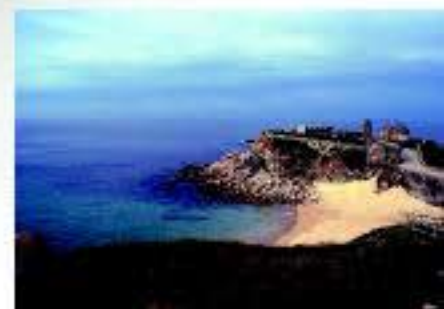
Un territorio lleno de leyendas