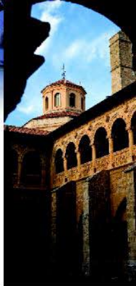
Monasterio de Santa María de Valbuena

recorrerse tanto a pie como en bicicleta. El mismo cauce, además, sirve para practicar deportes acuáticos como el piragüismo. De vuelta a los viñedos, también cabe la posibilidad de realizar excursiones a caballo por las vides y, por supuesto, cursos de cata y visitas a bodegas.