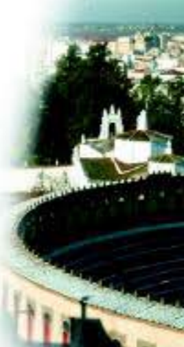
Santuario de Ntra. Sra. de la Piedad y Plaza de Toros

Varios son los municipios integrados en la ruta, todos vinculados tradicionalmente a la cultura del vino. Es un territorio que sorprende por sus paisajes, patrimonio cultural, una gastronomía excepcional y unas gentes que hacen sentirse muy especial. El epicentro se sitúa en Almendralejo, Ciudad Internacional del Vino, donde el paisaje de viñedos se combina con un rico patrimonio cultural e histórico. Allí se puede visitar el Museo de las Ciencias del Vino, donde confluye el arte, la tradición y la tecnología, y su plaza de toros, la única en el mundo que cuenta con una bodega debajo de su graderío.