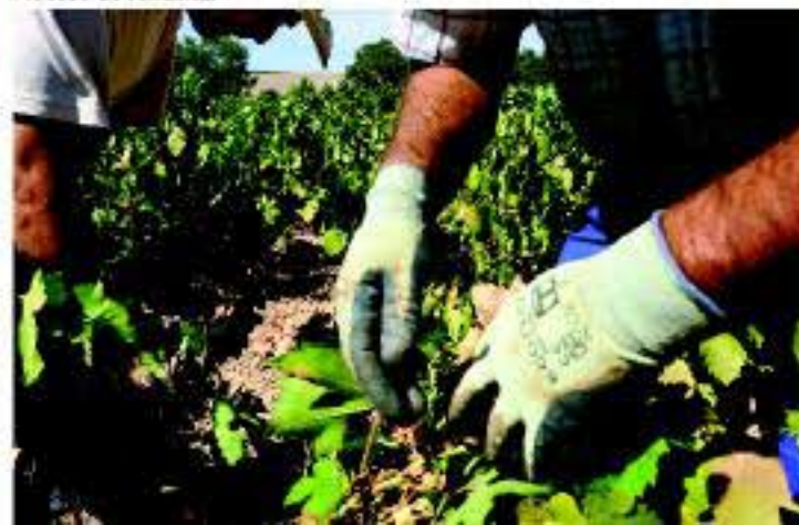
Proceso de vendimia

Y es que todos ellos nacen de la variedad Pedro Ximénez. Lo primero que llama la atención es el abanico de colores y tonalidades desplegado. Lo segundo, los distintos aromas inconfundibles que van desde el frescor de la fruta hasta la madera más noble, continuando con la espectacular sensación al llegar al paladar y su recuerdo imborrable.