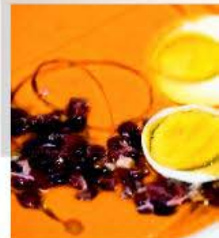
Gastronomía típica de Montilla Moriles

La Ruta del Vino Montilla-Moriles goza de una rica gastronomía basada en productos de la tierra: la aceituna, la uva, los cereales, el ajo, a los que se une el peso de las culturas que por allí pasaron, árabe, judía y cristiana. Como platos estrella destacan el salmorejo, el flamenquín, el rabo de toro, las gachas de mosto, las tomijas... Nuestro vino va de la mano de nuestra gastronomía, bien acompañando a nuestros exquisitos platos, bien participando en la elaboración de ellos.