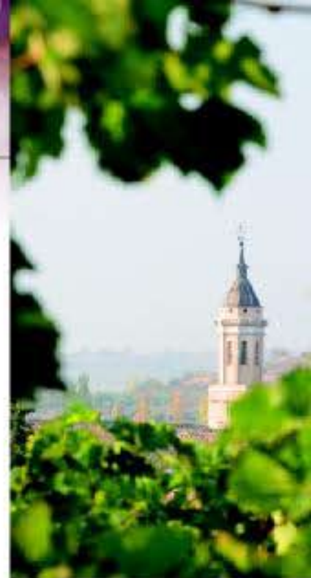
Cultura y naturaleza, de la mano

quetas de nieve, parapente, kitesurf, windsurf... todo, aquí, en la Ruta del Vino del Campo de Borja. Para relajarse después de tanta actividad, confortables alojamientos rurales y para reponer fuerzas, restaurantes de comida tradicional con toques modernos y bodegas familiares donde degustar vinos de garnacha del Campo de Borja.