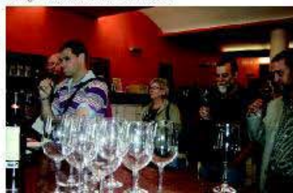
Bodega en la Ruta del Vino de Navarra

Navarra, región con una larga historia, atesora una memoria rica en manifestaciones artísticas y culturales de las que, por su naturaleza, el vino no ha sabido sustraerse. Así como el vino se transforma y desarrolla sutiles y complejos aromas con el paso de los años, la tierra que lo custodia ha sabido también desarrollarse con él sin apartarse por ello de la tradición. El momento presente que vive el vino de Navarra es fruto de un largo recorrido a través de casi 20 siglos. Hoy, la D.O. Navarra apuesta por la modernización y se ha consolidado como zona de vinos de calidad, sorprendiendo con sus embotellados de vino tinto, rosado, blanco y moscatel. La Garnacha es la variedad más extendida, que deslumbra con especial intensidad en los rosados y en los vinos tintos más jóvenes.