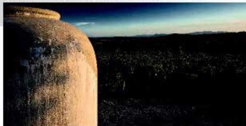
La campiña cordobesa, cuna del vino Montilla Moriles.

el año de oportunidades para brindar con el vino de la tierra y disfrutar de nuestra gastronomía. Muchas de estas fiestas están declaradas de interés turístico.