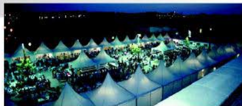
Muestra Gastronómica, Festival Vino de Somontano

vinos y tapas se alía con la mejor música, dejando paso durante el día a una oportunidad única para conocer y disfrutar las múltiples propuestas de nuestro privilegiado territorio.