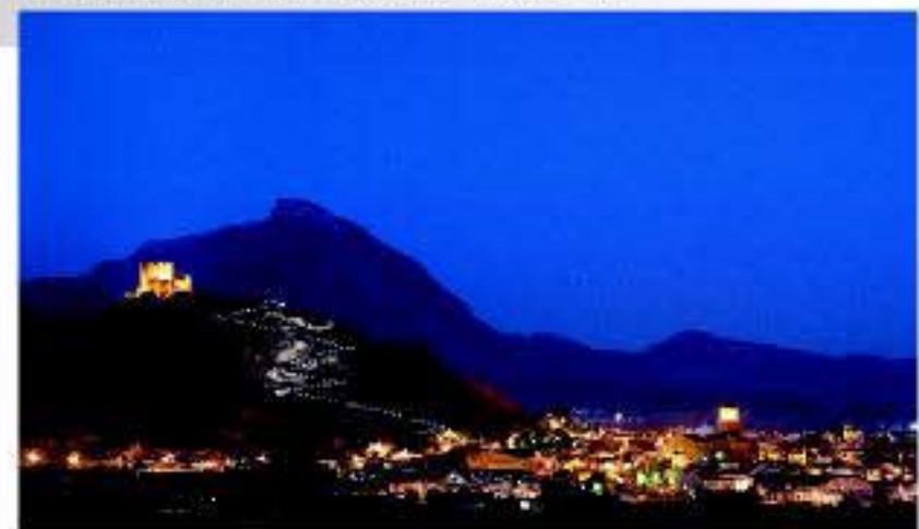
Vista nocturna del Castillo de Jumilla

la Virgen de la Asunción. Otros eventos importantes son la Fiesta de la Vendimia, que culmina con la gran Cabaigata del Vino: el Festival Nacional de Folklore "Ciudad de Jumilla"; y la Fiesta de Moros y Cristianos.