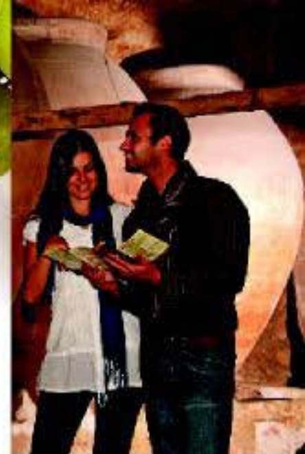
Las antiguas bodegas nos narran la larga tradición vitivinícola de la zona.

rutas de senderismo y montaña con espectaculares panorámicas en el río Cabriel, realizar actividades de turismo activo, descubrir yacimientos arqueológicos y geológicos, etc. todo es posible en la Ruta del Vino Utiel-Requena.