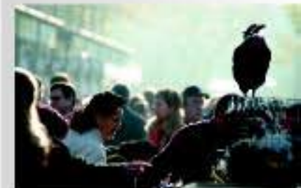
Fira del Gall de Vilafranca del Penedès

En la mesa, acompañando los vinos y cavas del Penedès, también se reserva un espacio privilegiado para una rica y gustosa gastronomía autóctona. La cocina más tradicional es la de las aves de corral, bajo el reinado de los patos mudos y los gallos de raza Penedès. Los restaurantes no descuidan la buena cocina de aves de corral, ofreciendo una carta en la que también se pueden encontrar platos más de temporada, como el xató, típico de las comarcas del Penedès y el Garraf. Cabe añadir además los embutidos de elaboración artesanal y la pastelería, con las catànies, los carquiñolis, la coca y las garlandas.