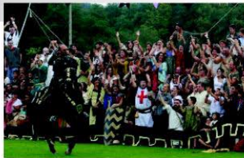
La Festa da Istoria, declarada de interés turístico nacional, convierte a Ribadavia en una verdadera villa medieval

lugar La Mostra Internacional y, por último, destaca la la Festa da Istoria, que el último sábado de agosto convierte durante un día a Ribadavia en una auténtica villa medieval.