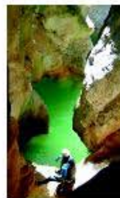
Barranco de Mascuín

Las posibilidades que brinda esta ruta son infinitas. No faltarán oportunidades para recrearse en el mundo del vino, ya sea visitando bodegas, realizando novedosas actividades en viñedos, haciendo cursos de cata o simplemente disfrutando de una copa en buena compañía. En plena naturaleza, una amplia red de itinerarios senderistas y ciclistas señalizados