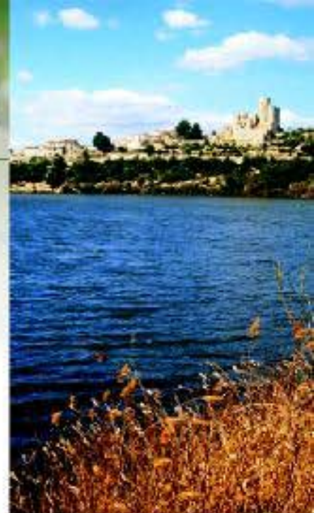
Parc del Foix

paseos guiados, a pie o en bicicleta, entre viñedos y realizando catas de vino y de cava, conocer sus fiestas, su arquitectura y su patrimonio cultural y natural mediante las Rutas del Modernismo, la Ruta de los Castillos o las rutas guiadas a los parques naturales y comarcas. La experiencia se puede repetir tantas veces como se quiera con la pareja, la familia, los amigos o los compañeros de trabajo.