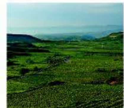
Paisaje de viñedos Rioja Alta

De algunos municipios son característicos determinadas clases de vino; así, San Asensio es la cuna del clarete. Pero en todas las localidades se pueden encontrar prestigiosos vinos de año, crianzas y reservas, además de producirse exquisitos blancos, algunos fermentados en barrica.