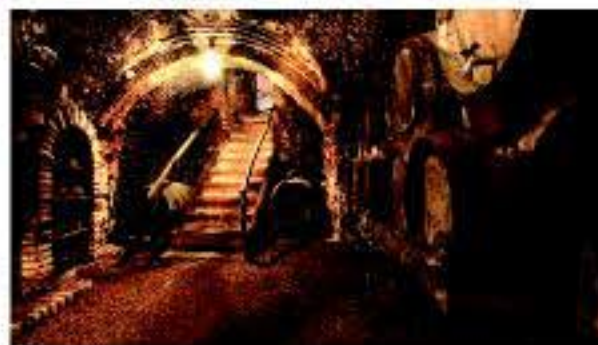
Bodega en casco, Tierra de Leyendas

El Imperio de la Garnacha tiene casi 8 siglos de edad; los viñedos más antiguos de la D.O. datan de 1145 y de los 5.000 hectáreas de garnacha, más de 2.000 tienen edades comprendidas entre 30 y 50 años. Sus producciones son bajas, pero inmensamente apreciadas enológica y aromática que proporcionan a los vinos. En la zona baja, encontramos garnachas en vaso y en espáldera. Sus vinos son cálidos, potentes y muy aromáticos. La zona media se caracteriza por tener la mayor concentración y densidad de viñedos. Son los suelos de las terrazas del río Huécha, con vinos muy complejos, intensos, estructurados y carnosos. La zona alta de la D.O. corresponde a las estribaciones del Moncayo, con vinos finos, sutiles y elegantes.