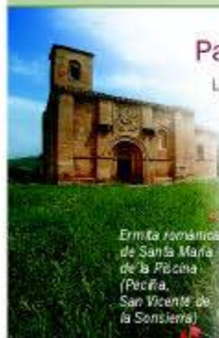
Ermita Románica de Santa María de la Ribota (Pecina, San Vicente de la Sonsierra)

La diversidad y riqueza del patrimonio histórico-artístico de Rioja Alta no es sino un reflejo del paso de la historia por La Rioja. Desde dólmenes, un indicador de la existencia de poblamientos en la zona en la Prehistoria, hasta imponentes iglesias barrocas, al pasear por Rioja Alta se descubren las distintas cepas de su historia. Todos los estilos arquitectónicos y artísticos están representados en la Ruta del Vino Rioja Alta, componiendo un conjunto que va desde las ermitas románicas hasta los castillos y fortalezas, pasando por monasterios e iglesias que destacan en el horizonte.