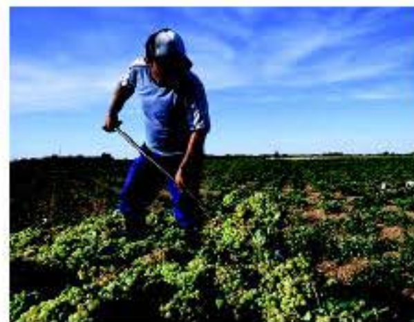
Trabajo de recolección en época de vendimia

Por su extensión (más de 190.000 hectáreas) en La Mancha afirman con orgullo que son el mayor viñedo del planeta, con una amplia variedad de vinos que van desde sus excelentes tintos hasta burbujeantes espumosos, sin olvidarse de los blancos y rosados de magnífica calidad. Vinos de autor, de alta expresión y gran tradición, vinos con personalidad propia. Junto a los Vinos de la Tierra de Castilla y Pagos, la D.O. La Mancha, controlada por el Consejo Regulador desde 1976, acoge a más de 400 bodegas que cuidan con esmero la elaboración de sus productos y que han experimentado una gran evolución adaptándose a las exigencias de la demanda del mercado. Estas referencias no sólo corresponden a una situación geográfica específica, sino que son la garantía de calidad de sus vinos.