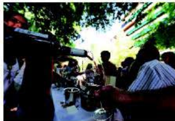
Feria del Vino de Jumilla

Los vinos de la D.O. Jumilla están elaborados a base de la variedad Monastrell, la cual representa más del 80% de la superficie cultivada. Es una variedad poco productiva pero la que mejor se adapta al clima de la zona y a las pocas lluvias que caen durante el año. De la misma se obtienen vinos potentes, expresivos, con unos colores violáceos y una redondez muy difícil de superar. A partir de la década de los 90, la uva Monastrell está dando lugar a una generación de elegantes vinos, convirtiendo al vino de Jumilla en un valor en alza. Los rosados y los tintos elaborados principalmente con Monastrell se caracterizan por su frutalidad, intenso color y fuerza. Los vinos blancos elaborados con uva Macabeo son limpios y brillantes y destacan por su frescura.