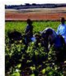
Actividades en viñedo en la Ruta del Vino de Navarra

de público el cultivo de la vid de forma amena y sencilla. Se encuentran señalizados y contienen información impresa y audiovisual sobre el entorno, los procesos y los elementos de especial relevancia histórica, cultural y natural relacionados con el vino y su amplia cultura.